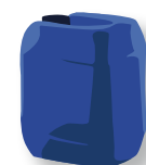
10 l Solarflüssigkeit