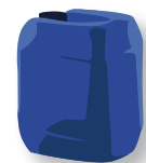
10 l Solarflüssigkeit